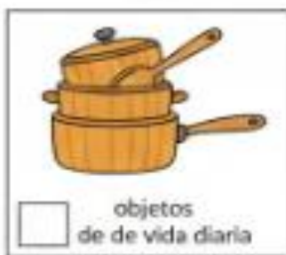
objetos de la vida diaria