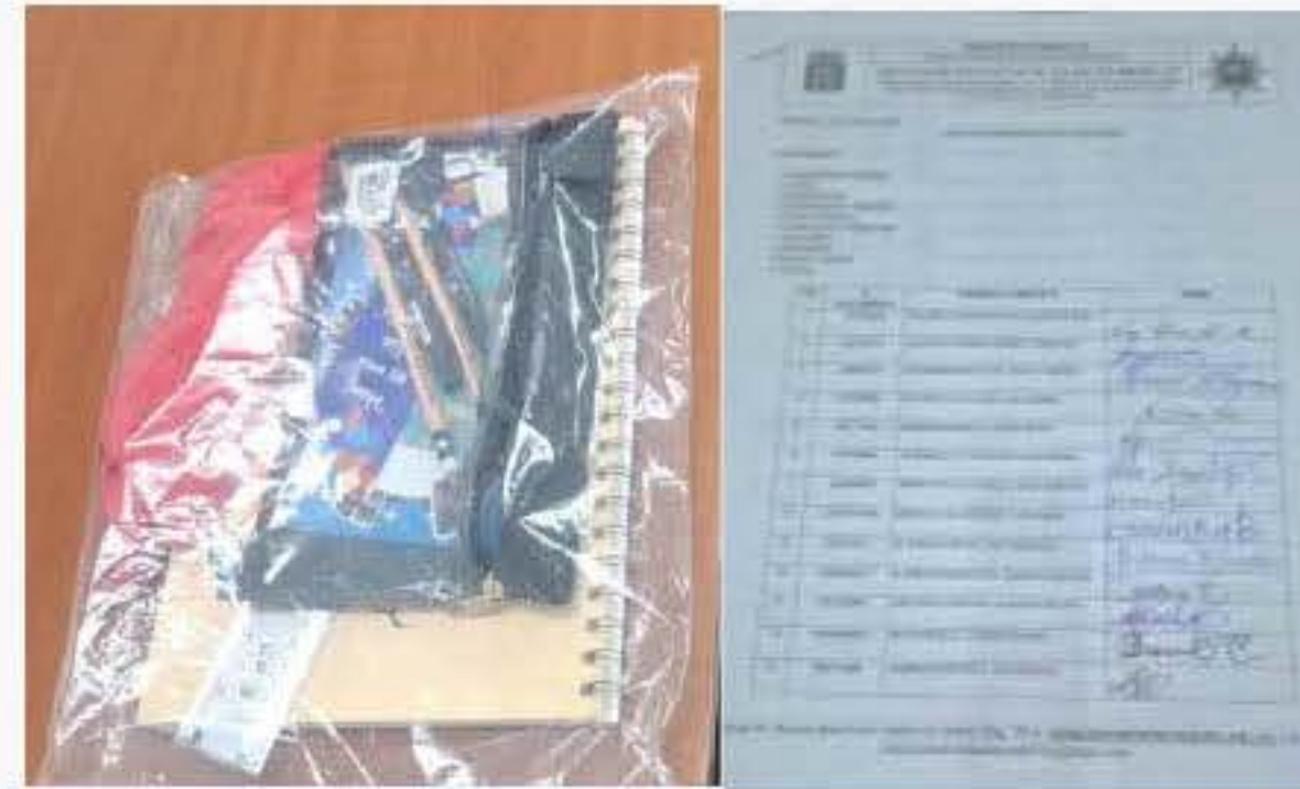
70 Kits de útiles para docentes