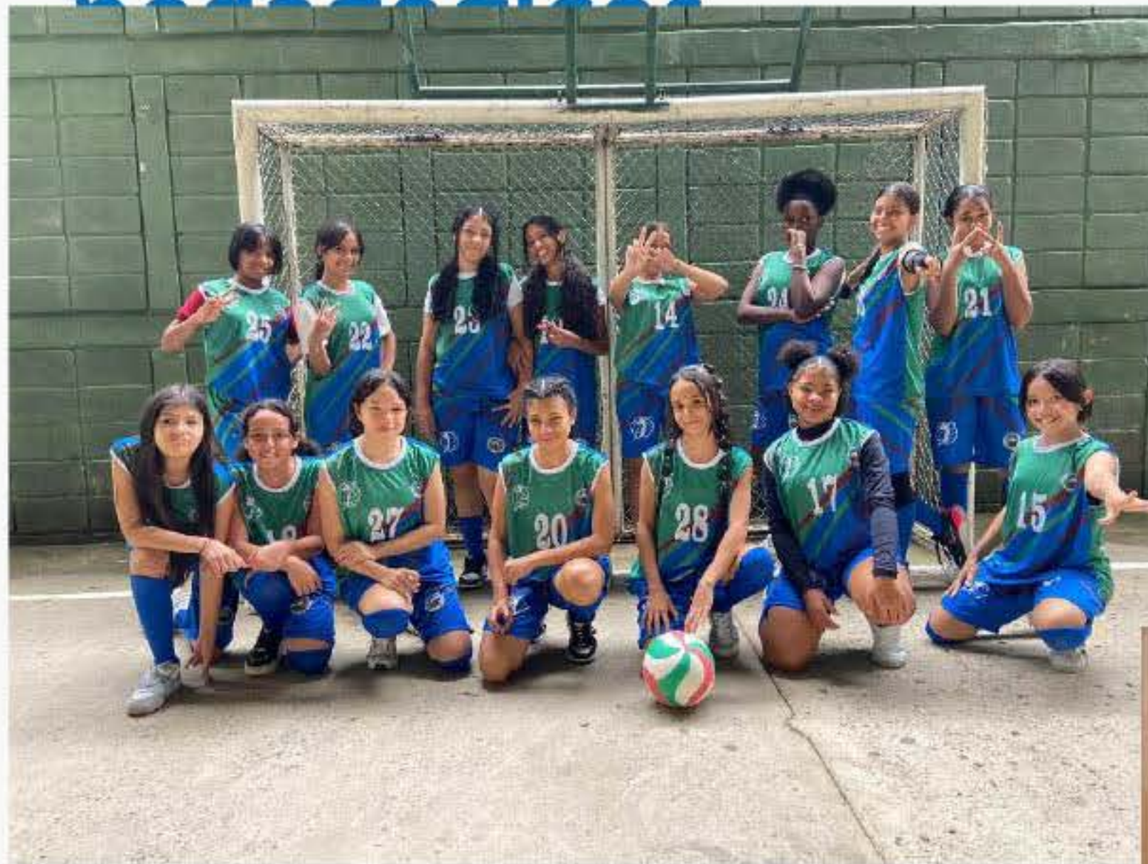
24 uniformes para voleibol